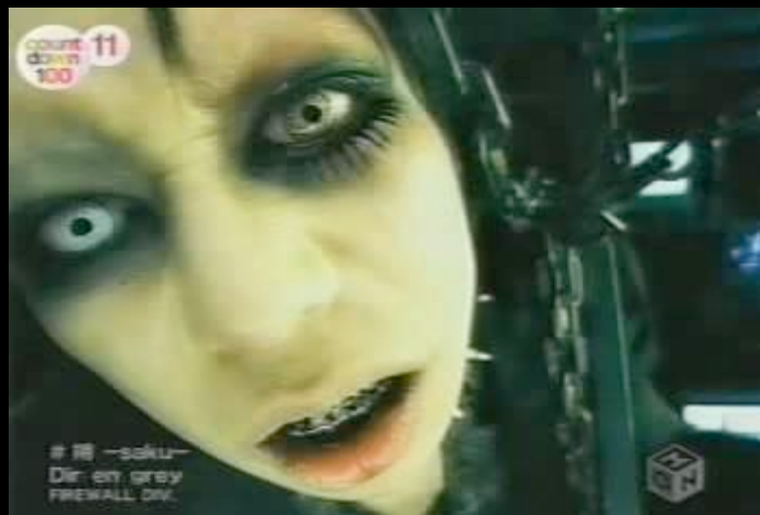
Dir en grey – Saku Japan 2004