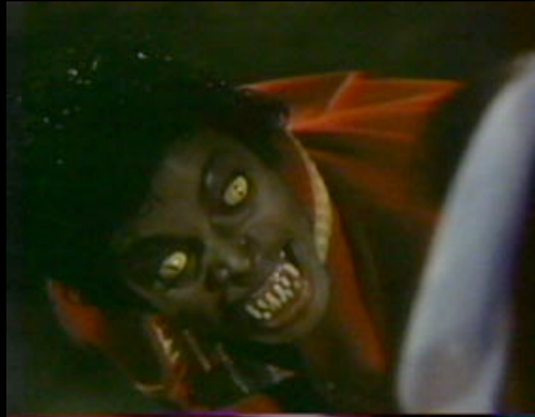
Michael Jackson – Thriller USA 1983